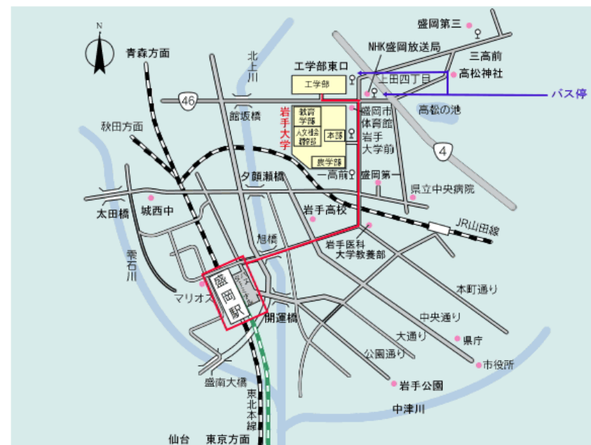
盛岡駅（東口）より岩手大学（工学部）へのアクセス